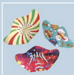
masques adult - enfant