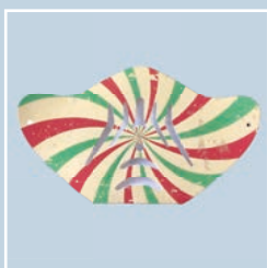
masque fermé avec filtre