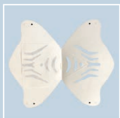
masque ouverte avec filtre