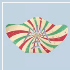
mascherina chiusa con filtro