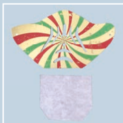
mascherina e filtro

Kit composti da 5 mascherine e 15 filtri