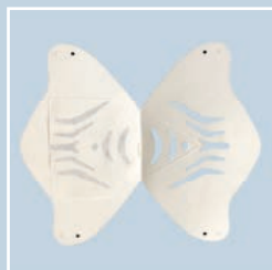
mascherina aperta con filtro